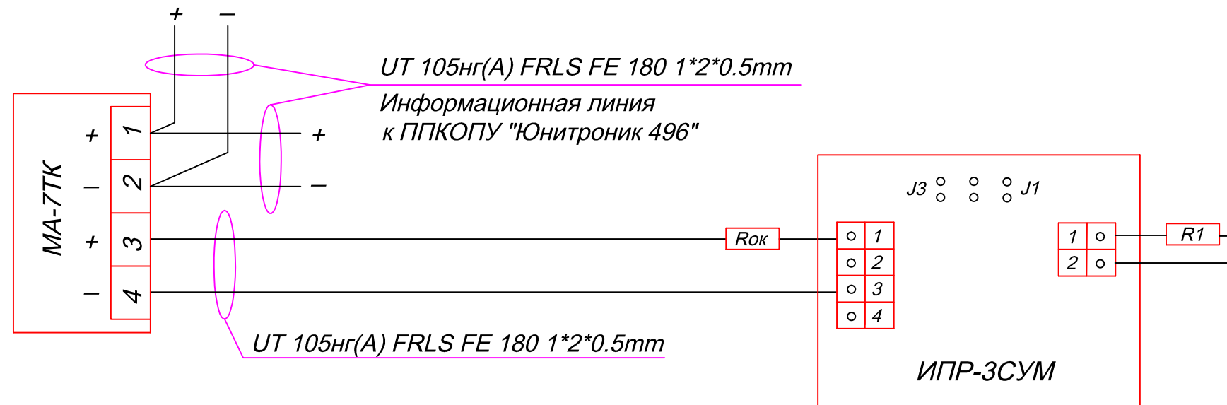
Схема соединения МА-7ТК и извещателя пожарного ручного ИПР-3СУМ.

R1 = 5,6 \text{ кОм } \pm 5\% \text{ P} = 0,25 \text{ Вт} R_{ок} = 560 \text{ Ом } \pm 5\% \text{ P} = 0,25 \text{ Вт}