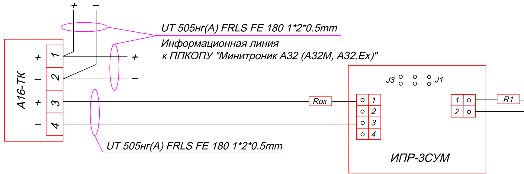
Схема соединения А16-ТК и извещателя пожарного ручного ИПР-3СУМ.

R1 = 5,6 \text{ кОм } \pm 5\% \text{ P} = 0,25 \text{ Вт} R_{ок} = 560 \text{ Ом } \pm 5\% \text{ P} = 0,25 \text{ Вт}