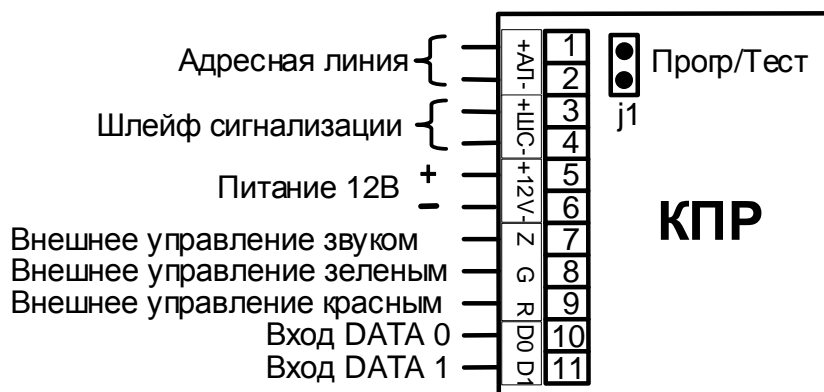
Рис. 2. Назначение клемм КПП.