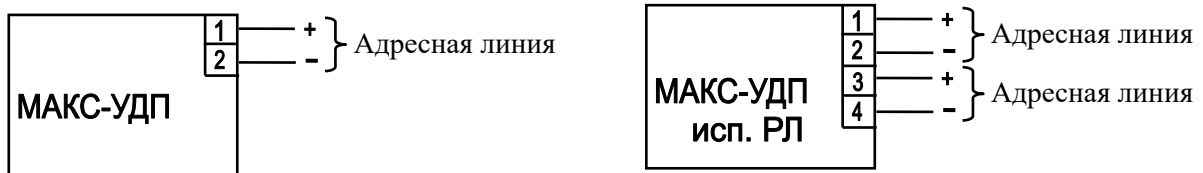
Рис. 2. Назначение клемм МАКС-УДП и МАКС-УДП исп.РЛ.